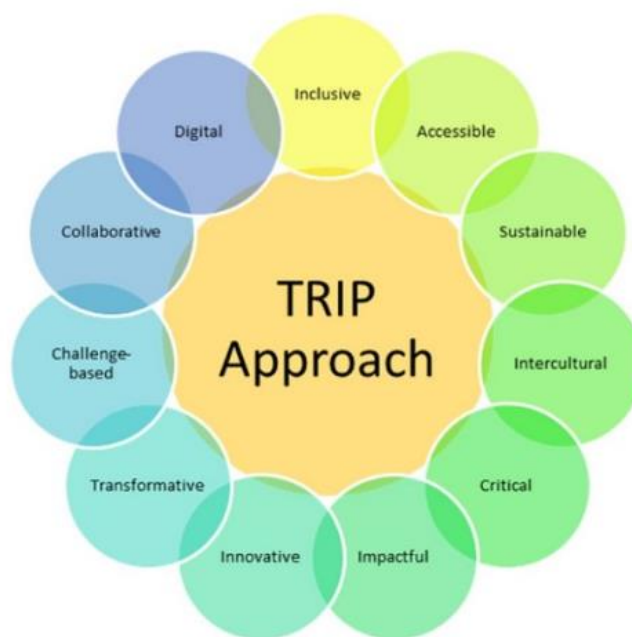
Figure 2 : Caractéristiques et valeurs fondamentales de l'e-module IVSC (PR2)

Ces résultats (PR2) seront conçus pour offrir à tous les étudiants des opportunités d'expériences éducatives internationales de haute qualité, en particulier à ceux qui ne peuvent pas bénéficier d'une mobilité physique, tout en favorisant la citoyenneté mondiale et en renforçant l'employabilité de nos étudiants. La Figure 2 met en avant les valeurs fondamentales et les caractéristiques clés que l'e-module IVSC cherchera à incarner, tant dans sa conception que dans son mode de mise en œuvre